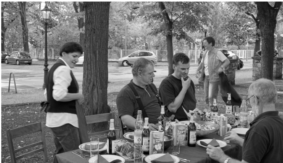
Warmer Herbstabend 2009 - Abendbrot für die Orgelbauer auf dem Kirchenvorplatz

mals handelte es sich um ca. 2 Wochen, und ich konnte das locker zwischendurch mit ein paar netten Gemeinde-, Chor- und Vereinsmitgliedern organisieren. Die Aufbauphase wird länger dauern, rund 4 Monate. In den ersten Wochen wird eine größere Besetzung, bestehend aus 4-6 Mitarbeitern, in Karlshorst sein, in den In-