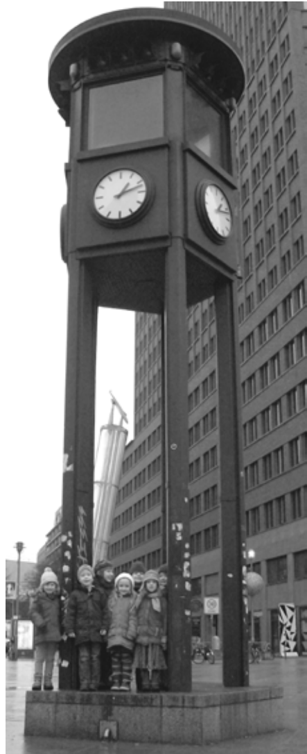
Wir stehen vor der ältesten Verkehrsampel Berlins am Potsdamer Platz