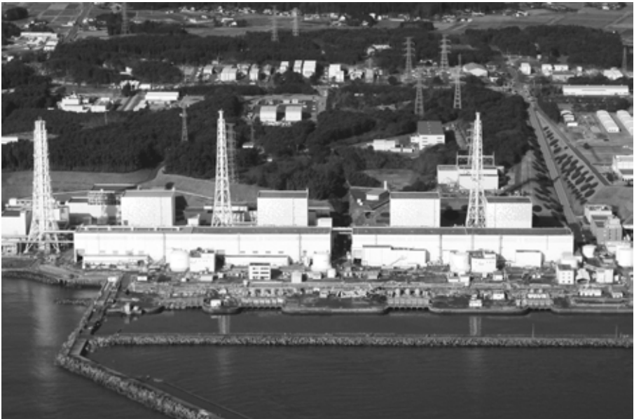
Fukushima-Daiichi; (Lizenzgeber: www.beaconradio.co.uk , CC BY-NC-ND 2.0)

Die Ursache moralischer Übel, zu denen ja nicht nur energiepolitische Entscheidungen, sondern auch z.B. Mord, Vergewaltigung oder Diebstahl und Steuerhinterziehung gehören, liegt in der Verantwortung des Menschen. Nicht Gott hat sich hier zu verantworten, sondern der Mensch. Gott hat dem Menschen einen freien Willen geschenkt. Damit hat er zugleich dem Menschen die Möglichkeit an die Hand gegeben, diesen Willen missbrauchen zu können. Doch warum, so die immer wiederkehrende Frage, verhindert Gott nicht den Missbrauch der menschlichen Freiheit und greift nicht ein? Warum hat Gott zu-