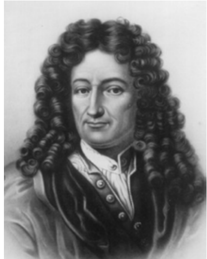
Gottfried Wilhelm Leibniz

Im Schöpfungsmythos besitzt der Mensch von Anbeginn die Willensfreiheit. Adam und Eva wird verboten, vom Baum der Erkenntnis zu essen. Das Verbot setzt voraus, dass beide sich für oder gegen die Akzeptanz desselben entscheiden können. Mit dem Verbot wird die Willensfreiheit gesetzt. Doch die Willensfreiheit hat ihren Preis. Mit ihr verbunden ist noch nicht die zwangsläufige Existenz von Leid, aber die Möglichkeit der Leidzufügung ist durch sie gegeben. Es war die Entscheidung Gottes, uns als freie Wesen zu schaffen. Er hätte den Menschen auch wie einen Computer schaffen können, der durch sein integriertes Programm in allen seinen Möglichkeiten festgelegt ist. Wir hätten auch als Marionette geschaffen werden können. Wir hätten auch vollkommen instinktgebunden lammfromm und ein Leben lang Salat essend durchs Leben gehen können. Er hätte auch ganz auf den Menschen verzichten können. Doch die Entscheidung Gottes fiel zugunsten der Schaffung eines Wesens aus, dem er die Willensfreiheit mitgab. Das kann ich bedauern oder bejubeln. Die Möglichkeit der Leidzufügung gehört seitdem zum Risiko meiner Lebensgestaltung, für